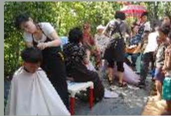
Missionsteam aus Korea demonstriert Gottes Liebe in Inayawan, einer Armensiedlung nahe der Müllhalde, durch kostenlose Haarschnitte