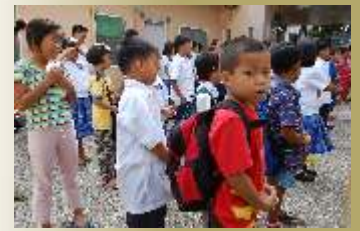
Nehemia Schule bei der Eröffnung vom Schuljahr 2008-2009 mit armen, aber ‚privilegierten‘ Schülern, die aus den Essensausgaben von CFA kommen