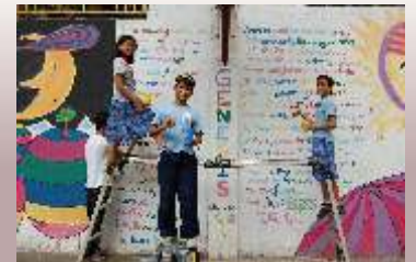
Nehemiakinder genießen ihre Ferien bei einem Projekt im „Wandbemalen“

Auszug von der Schulabschlußrede Jeffer Canetes, Schule für Zukunft durch Bildung 2009